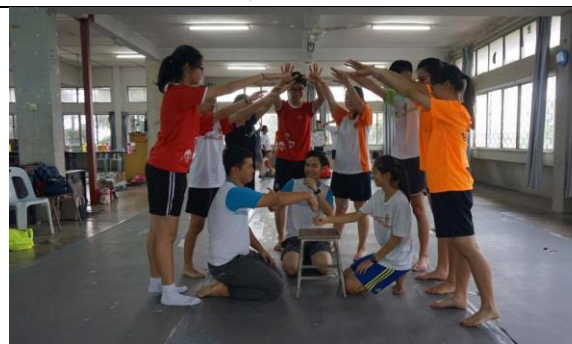
藝術工作坊排演過程