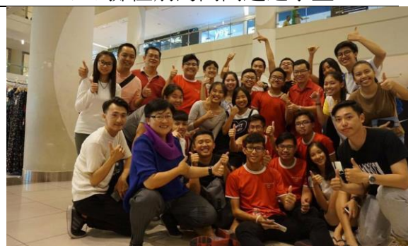
藝術工作坊演出團隊