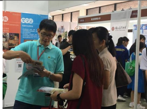
吉隆坡攤位前詢問問題之學生