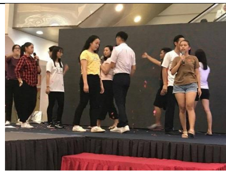
於怡保大賣場公演預演過程