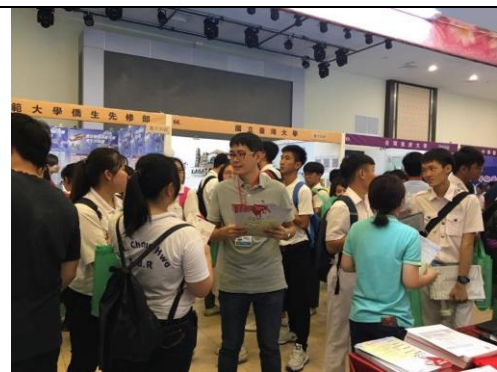
永平攤位前詢問問題之學生