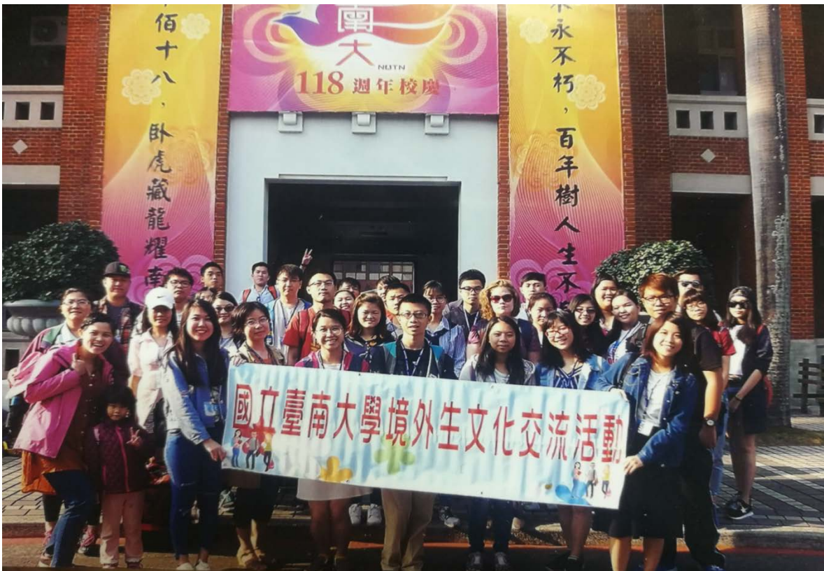
(愉快的綠島行，而且認識了許多有趣的外國朋友)