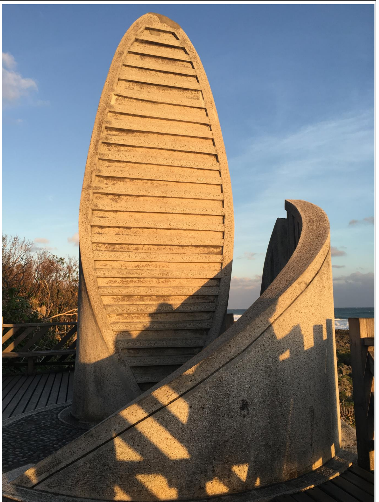
墾丁的尋找最南點之旅