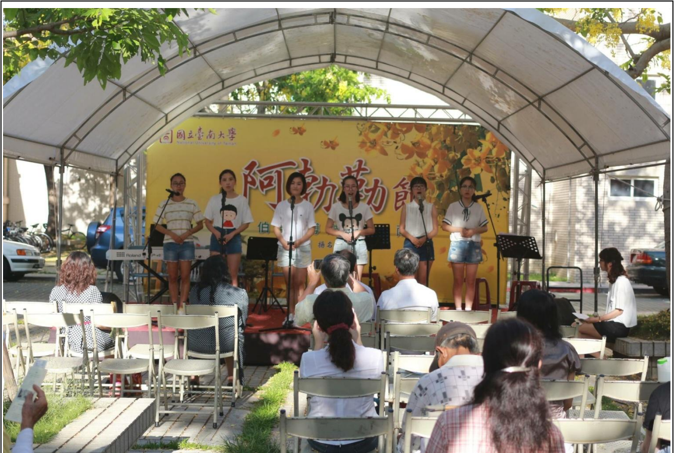
我和幾個交換生一起參加阿勃勒節，一起表演詩歌吟唱的照片～