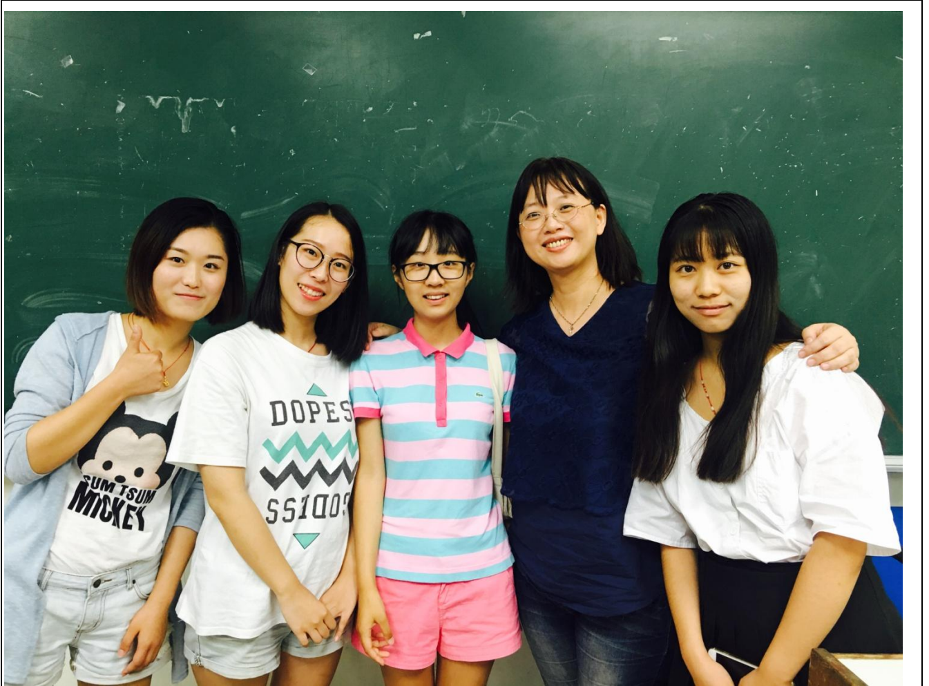
這是最喜歡的小昭老師，最後一節女性散文課的合照。