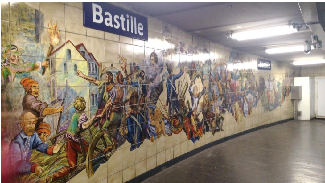
巴黎 Bastille 地鐵站