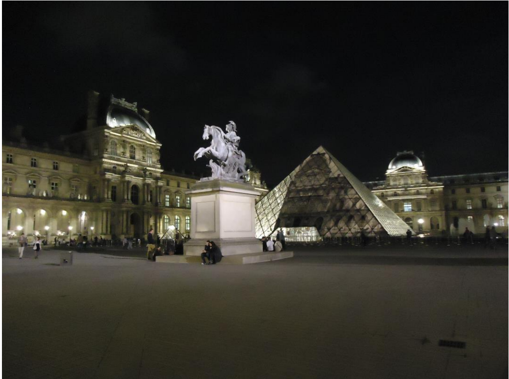
博物館之夜~羅浮宮