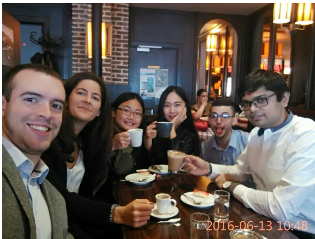
五種不同國籍的同學們一起完成期末報告