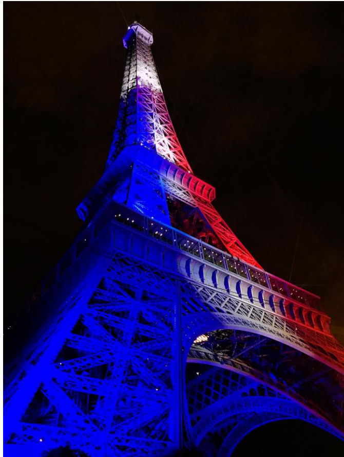
歐足盃每日賽後的鐵塔燈光秀