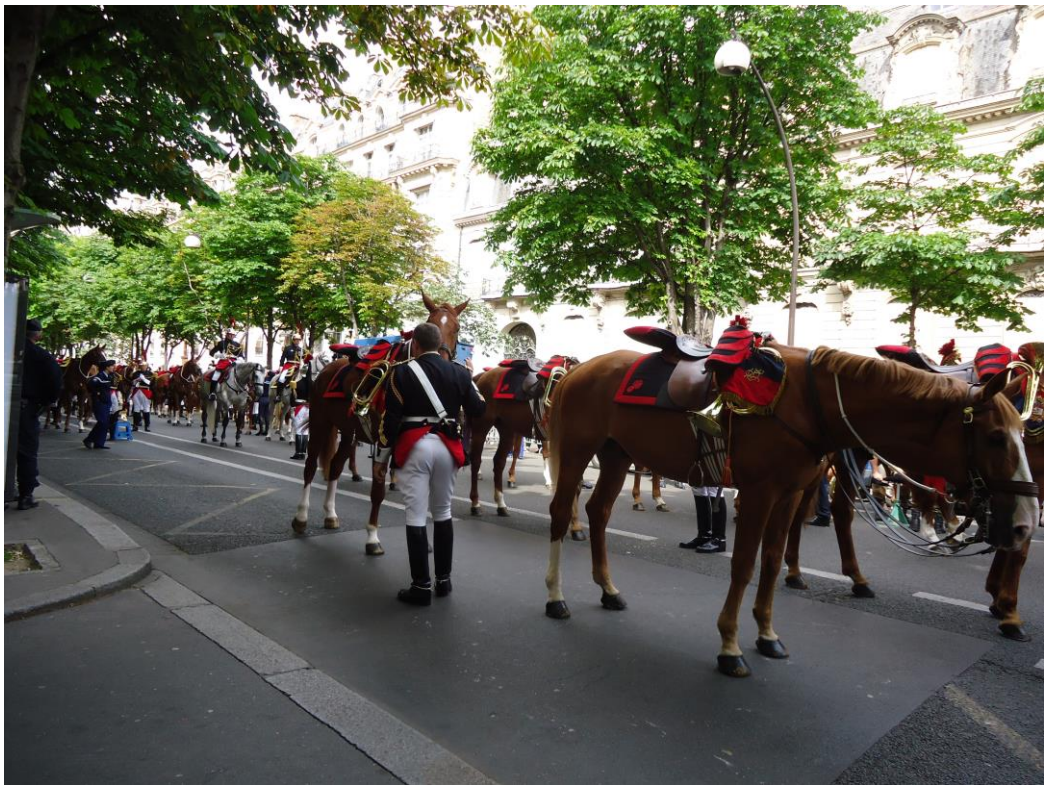
法國國慶閱兵儀式