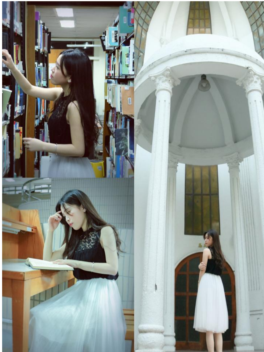
台南大學·圖書館 2016. 4