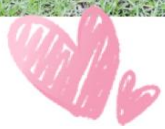
新光三越 台南市西門店