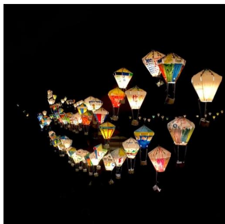
(臺東鐵花村的熱氣球燈)

臺灣是個美麗的地方，沒有到臺灣之前，我並不能體會到這一點。在我的意識裏應該是“臺灣是個有趣的地方”。但在這一學期裏，我和我的同學們去了臺灣許多地方旅遊，感受在地的文化和美景，讓我真真切切的感受到，臺灣不僅是個有趣的地方，也是個美麗的地方。