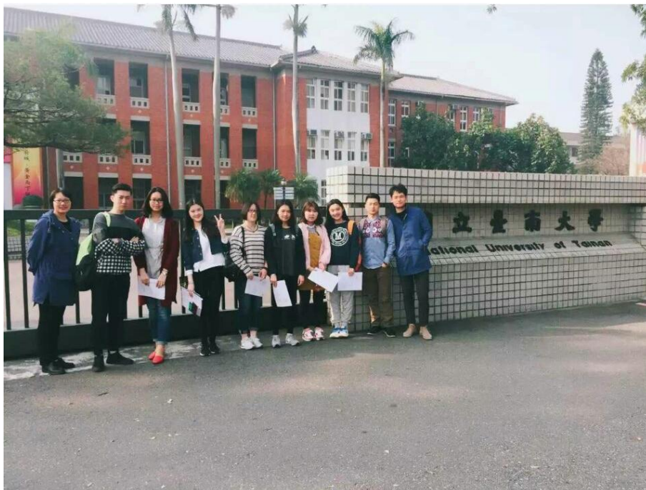
(湖北第二師範學院交換生合照)

阿裏山美麗的櫻花和日出、駁二特區新奇有趣的文創、墾丁和綠島漂亮的大海、各種不同形式的博物館和美術館、口味豐富的美食……這一件件回想起來都十分美好。