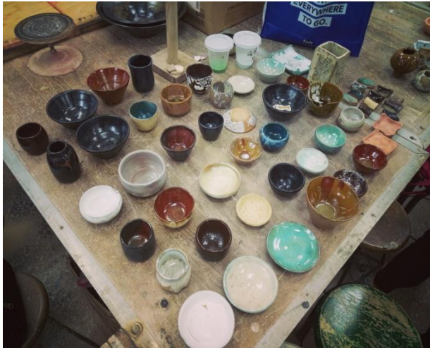
(我的部分陶藝作品)