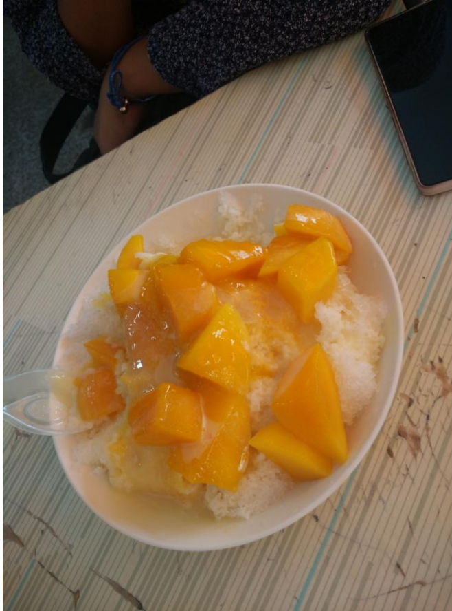
上圖是在高雄西子灣附近品嘗的海之冰

再來說說住宿問題，我在南大住在懷遠齋，對於浴室和廁所的環境，以及晾衣服的天臺都比較滿意。但是在宿舍裏，我認為宿舍的隔音有點差，非常容易被走廊裏同學的腳步聲吵醒，有時晚上睡得比較早，半夜同學在走廊上的腳步聲以及開關走廊燈的時候也會被驚醒。平時生活的另一個讓我擔驚受怕的就是蚊子，在宿舍裏我安裝了蚊帳，並且宿舍裏蚊子較少，但是在平時走在校園裏，經常容易被小黑蚊咬，一個不留神就被咬好幾個包，蚊不叮也沒用，這點比較頭疼。