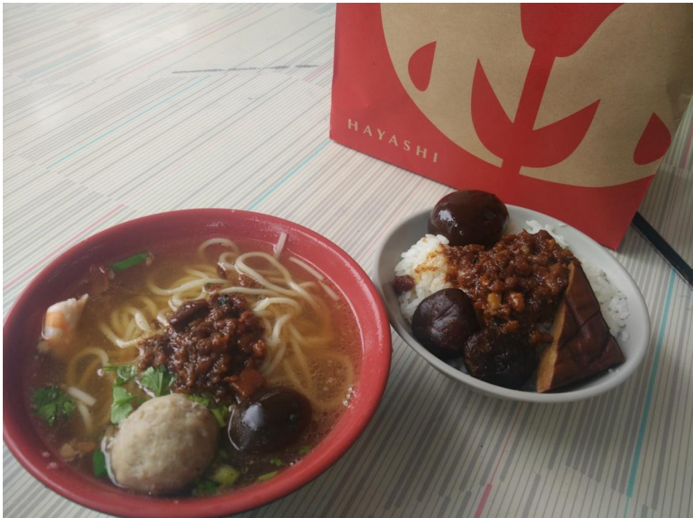
上圖為我在赤嵌樓附近吃的擔仔麵和肉燥飯，相比之下我更喜歡擔仔麵。

食物方面，我不得不說我愛上了台灣。無論是滷味、雞排、意麵，哪怕是普通便當，都能讓我食指大動。有同行的小夥伴向我表示台南的食物太甜，但我不這麼認為，也許從小吃的上海風味的食物也比較偏甜，因此對於台灣的美食，我是愛不釋手的。除了台南地區，在台灣其他地區品嚐到的食物也非常美味。在花蓮，我們吃到了非常美味的炸蛋蔥油餅；在台東，我們品嚐了著名的池上飯包；在高雄，我們在炎熱的夏日享受到了海之冰的清涼。