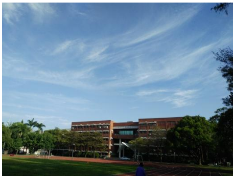
圖 2 晨跑時拍到的美麗的校園

灣美食最多、最密集的地方。就拿臺南大學來說，光是學校周邊就有非常多值得吃的地方，從入學到現在，我還沒有把學校周邊值得吃的地方吃遍，可想而知臺南的美食密度。並且臺南對於傳統文化的保護非常好，有非常多的歷史古跡。比如：孔廟、赤嵌樓、延平郡王祠、愛國婦人館等，這些歷史古跡都讓我對於臺灣的歷史及傳統文化有了更好地瞭解。坦誠的說，這是我第一次離開家這麼遠自己一個人出來。從小到大都在北京長大、北京讀書的我，可以說一直生活在父母的呵護下，根本沒有嘗試過一個人的生活。所以在出發來臺南之前，對於這段生活有憧憬，但更多的是擔心，甚至是恐懼。因為我不知道自己一個人的生活是什麼樣子，我有沒有能力去處理好生活中出現的問題。但是經過了一個多月的生活之後，我發現我漸漸學會了去獨自面對生活中的所有問題，有條理的打理好自己的生活。對於我自身而言，最大的收穫就是我學會了獨立、學會了和自己相處。和北京相比，臺南最大的不同應該就是這裏沒有我的家人、朋友，所以當我遇到一些很難過或者很委屈的事情時，我必須要學會一個人面對，一個人去消化這些負面的情緒。這在開始的時候對我來說很難，但是慢慢地我發現自己可以獨自去面對這些消極的情緒，其中最重要的途徑就是運動。這也是來了臺南之後養成的一個好習慣，不僅可以幫助我排解負面情緒而且還可以加強身體素質。