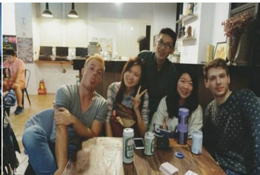
圖 3 在臺中旅行時遇到來自各國的朋友

以上就是我來臺南大學近半年的學習及生活的感受。我真的很喜歡臺南，很喜歡臺灣這個地方。喜歡他的美食，喜歡他的文化，喜歡當地人的熱情。這次為期半年的交流學習生活能讓我更充分的認識臺灣，並且更好地體會並融入到當地的生活中。當然，在這期間我也向臺灣當地人介紹大陸的現狀，也希望通過我自己小小的努力使他們對大陸有更加深入、更全面的瞭解。