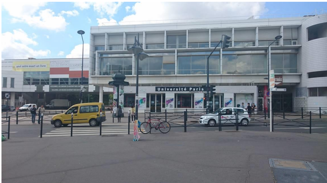
圖一、學校外觀(學校位於聖丹尼 Saint denis 為巴黎的郊區，人多治安很不好尤其是晚上，出門請小心並盡量結伴，地鐵站就在隔壁交通十分方便)