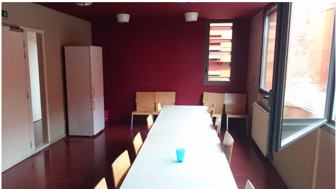
圖三、公共廚房(具有大部分廚具與餐具、微波爐等，不須帶電鍋或煮飯鍋，這裡都有通通都有賣)