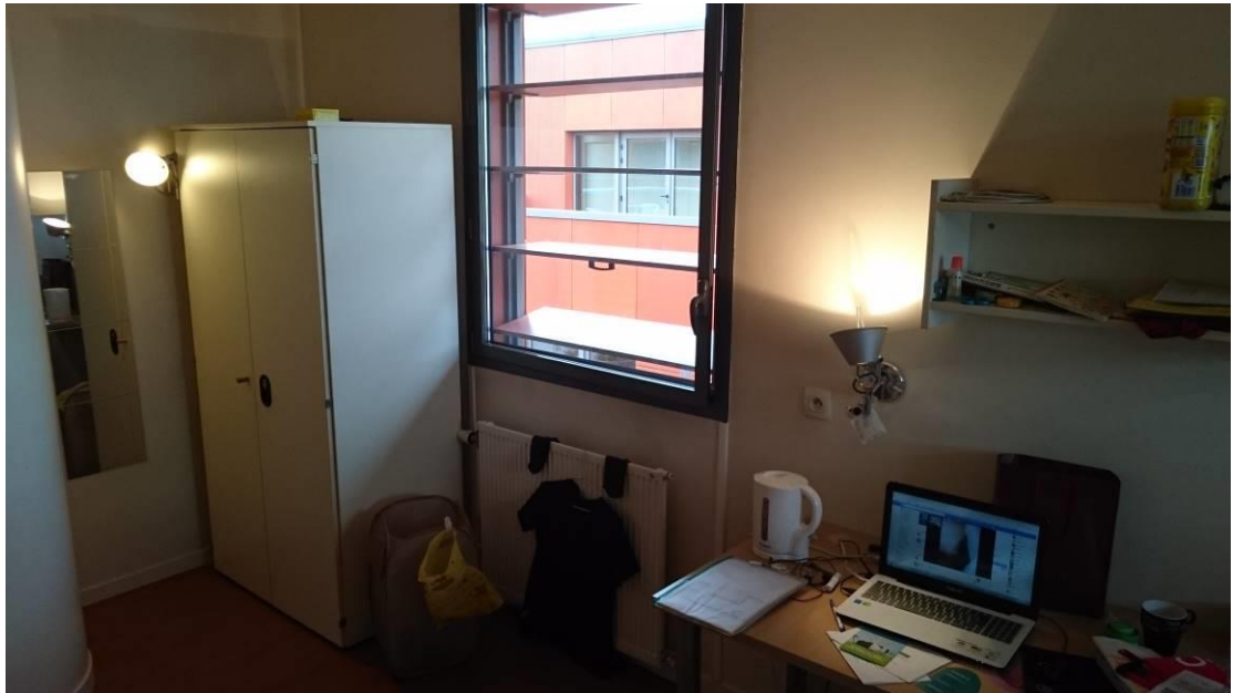
圖二、宿舍套房(空間很大、獨立衛浴、wifi、雙人床、水熱式暖爐、個人冰箱*有些房型僅有單人床)