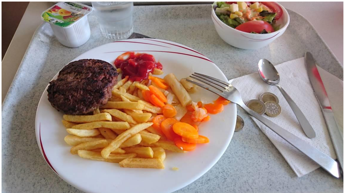
圖五、學生餐廳菜色(學生餐廳位於宿舍樓下，提供超值午餐 3.25 歐，1 主菜 1 沙拉 1 甜點，相較於外面麥當勞最便宜 4.9 歐，可說是懶得煮菜時便宜又健康的選擇)