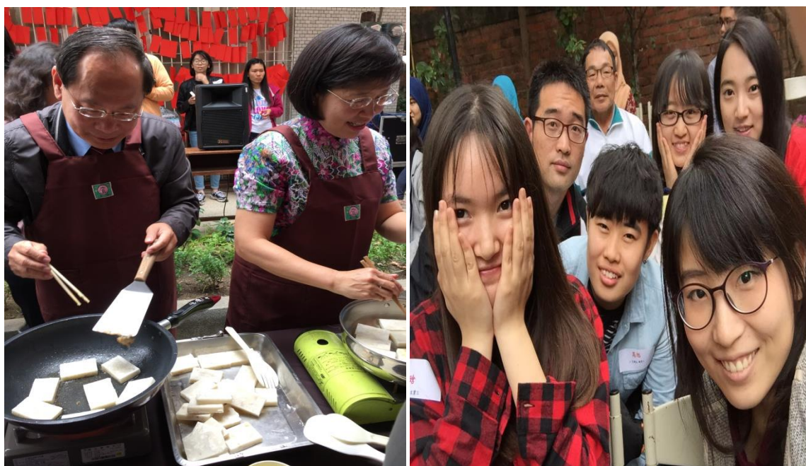
(拍攝時間：2015 年 3 月 11 日，拍攝地點：台南大學)

接下來這張圖是我對臺灣師生文化感知最深的一次，在校長在官邸請所有交換生吃飯聚餐。應該說這件事情在大陸是絕對不可能出現的狀況。所有的交換生基本到齊，各地帶了自己國家的特色美食。校長和校長先生一起為我們下廚做美食的情景一直在腦海，他們的親切讓我覺得毫無距離感，也體現出了台南大學最真切的熱情和誠意。感謝這次機會，讓緣分帶我們相遇。