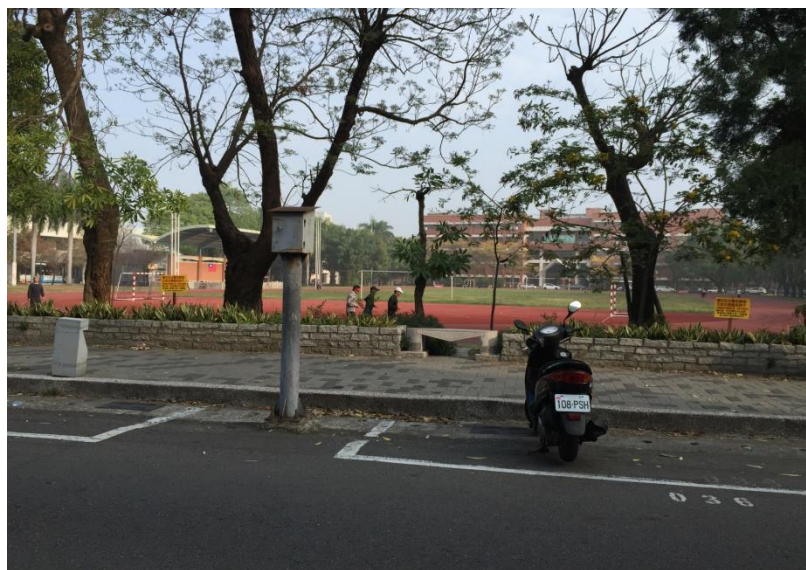
(拍攝於 2015 年 2 月 25 日，拍攝地點台南大學)

臺灣的第一觀感，臺灣人民的第一觀感。謝謝這裡的融洽，謝謝這裡教師同學的友善，讓在異鄉的我感受到親切。