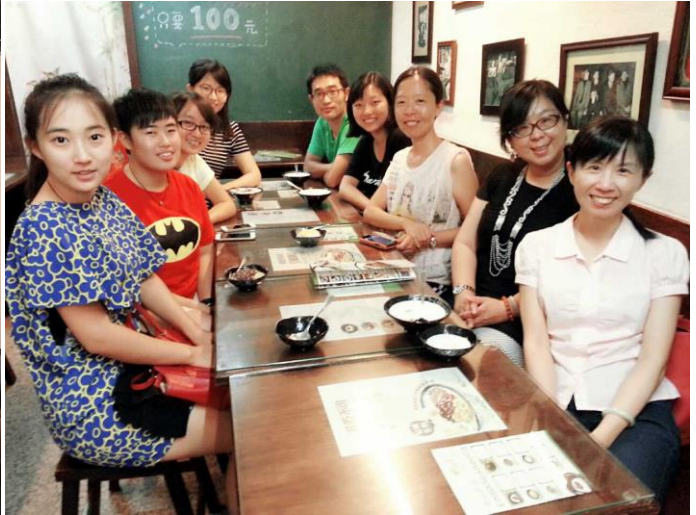
(拍攝時間：2015 年 3 月 5 日，拍攝地點：台南大學 A212)