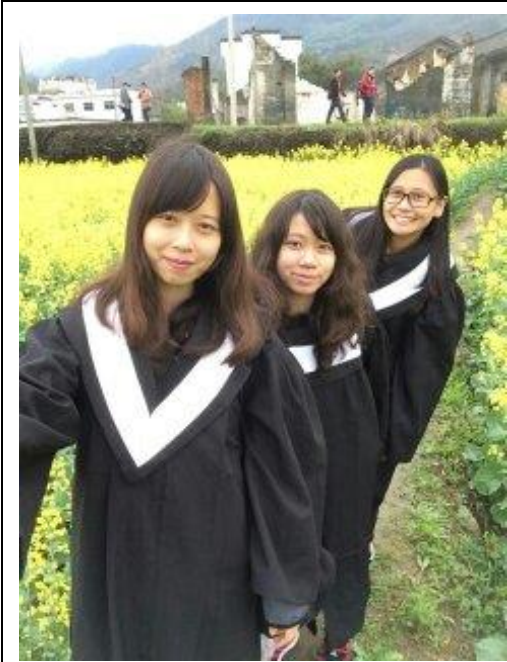
和台灣好友在江西 省婺源拍學士照