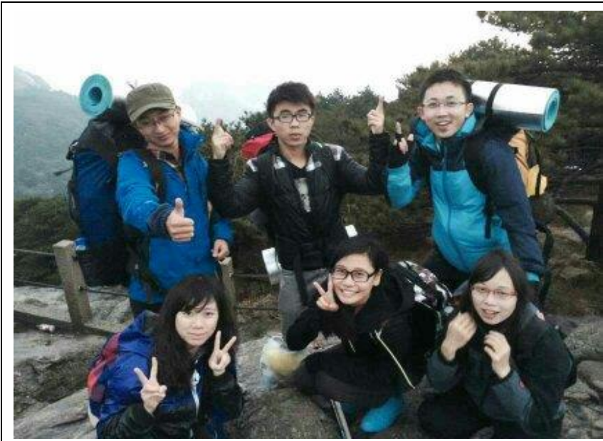
黃山歸來不看嶽 征服黃山光明頂