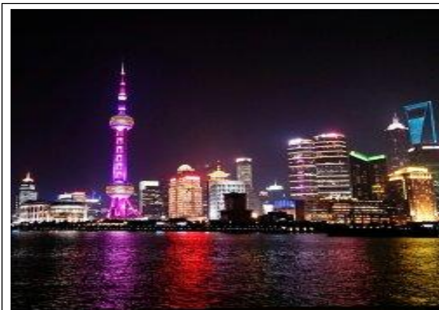
夜上海的東方明珠 和黃浦江