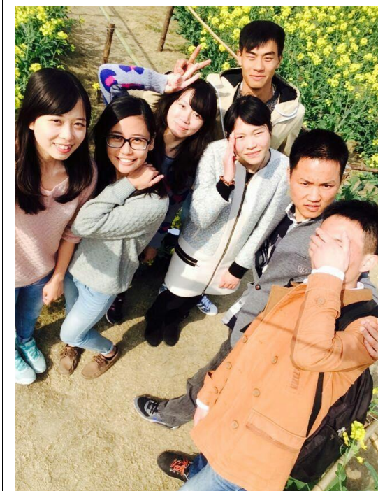
華師大閔行校區與大陸好友