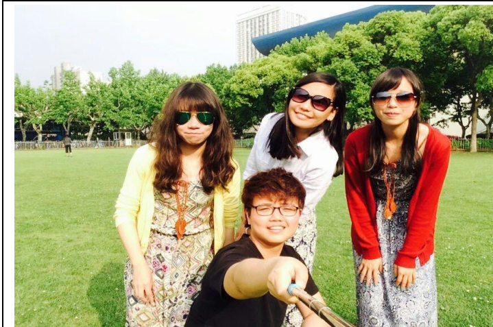
華師大中北校區草地與台灣好友