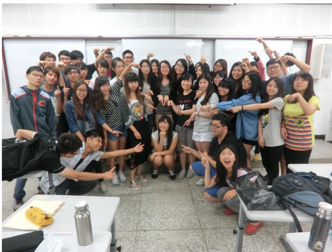
(圖一為在臺認識的交換生在南頭合影