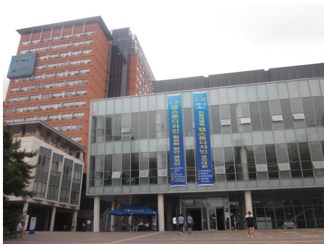
(大門入口處，橘色樓為宿舍)