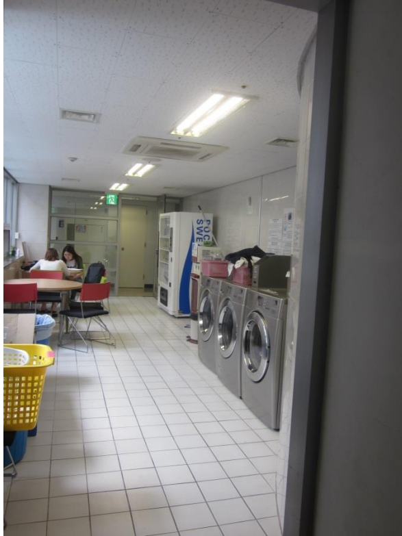
(宿舍每層樓的洗衣房及交誼廳)