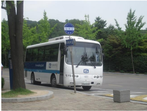
(校內至地鐵站的校車)