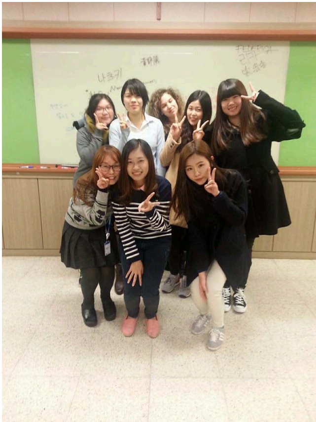
學期結束時不捨地與晚上韓語班的老師和同學們合照紀念