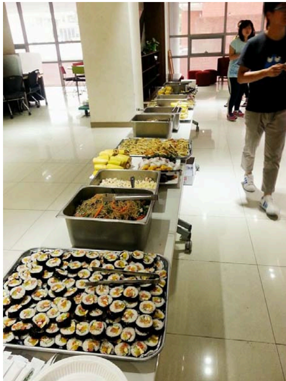
學校擔心外國學生們中秋節孤單，為我們準備了中秋節派對