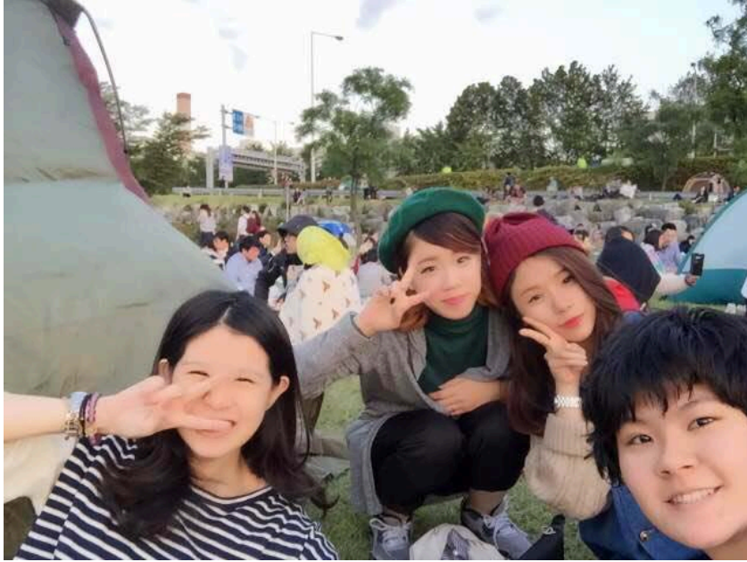
趁天氣還沒太冷時，到漢江體驗野餐的樂趣