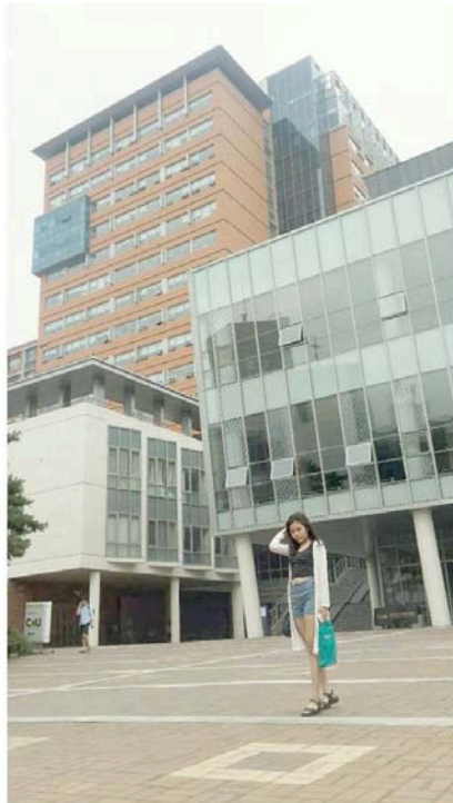
第一次抵達加圖立大學