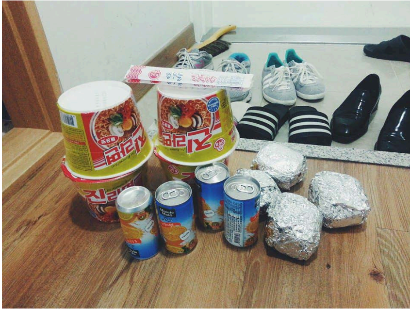
韓國大學特有的慣例，考試期間到宿舍分發食物