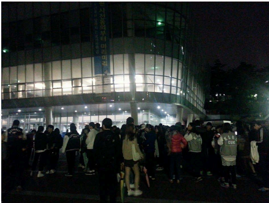
不止到宿舍發放食物，考試周也每晚都會在固定的地方發送補品