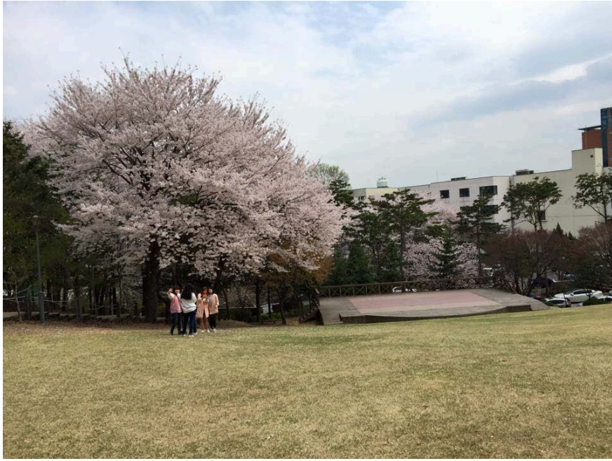
整個校園都被春天的櫻花包圍