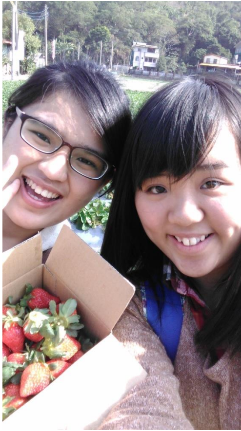
跟心媚回家鄉苗栗，在大湖採草莓