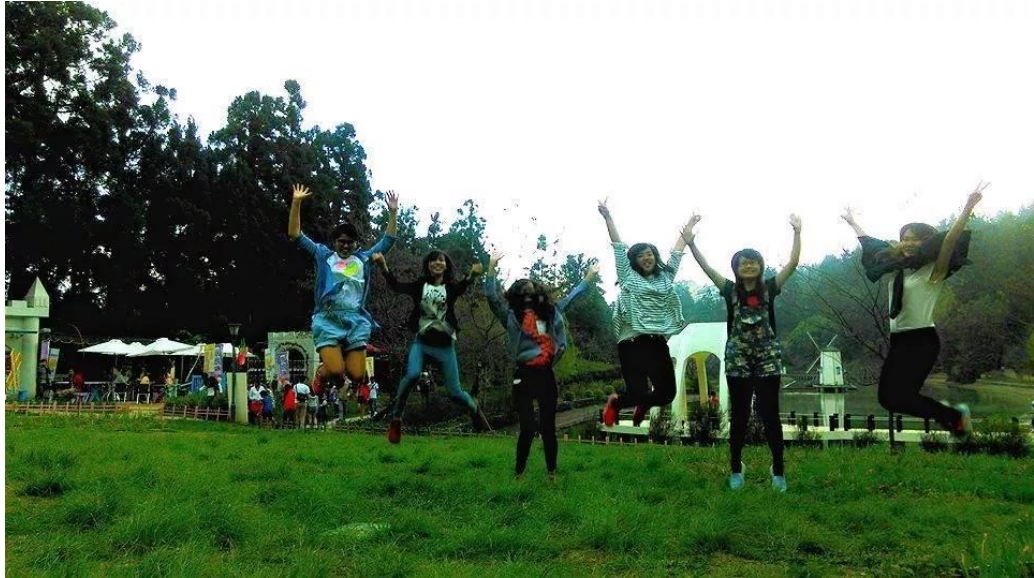
跟台灣同學結伴同遊清境，好天氣，好心情，Jump High!