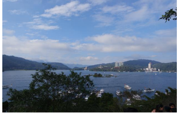
晴空萬里的日月潭。