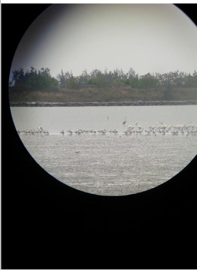
陳主任帶我們去觀看黑面琵鷺。