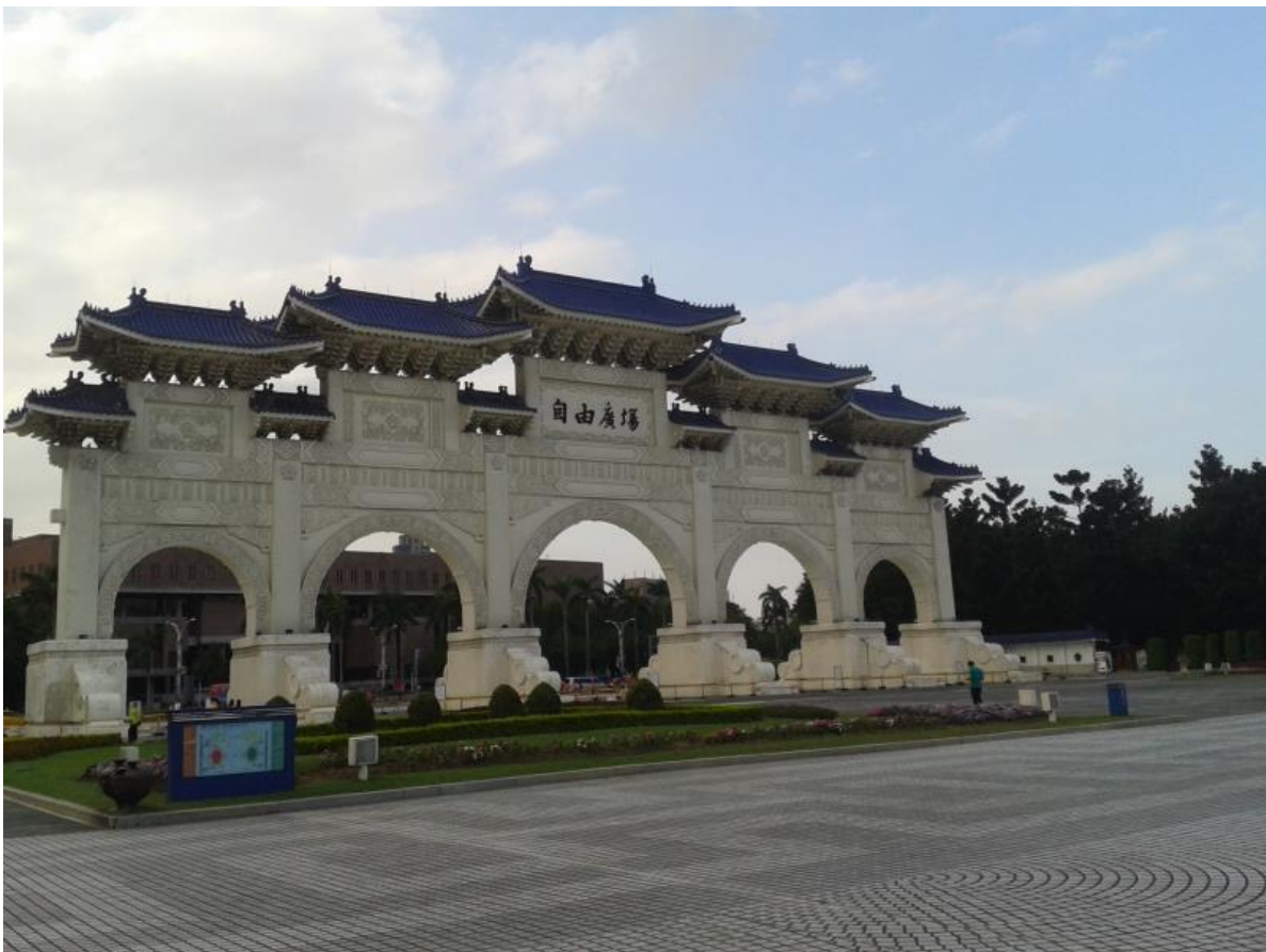
雄偉壯美的自由廣場