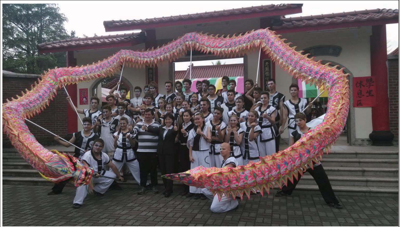
图三 高雄内江宋江阵比赛