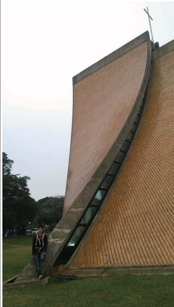
图四 东海大学 Luce Memorial Chapel