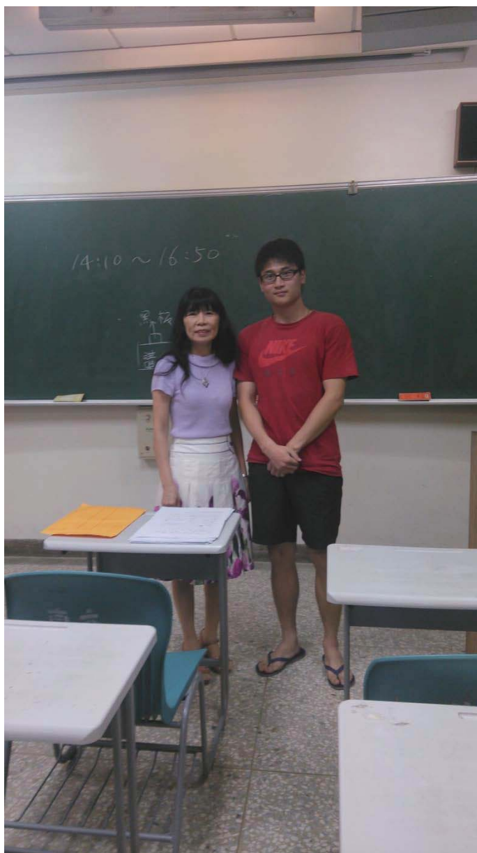
图五 易经课谢老师合照