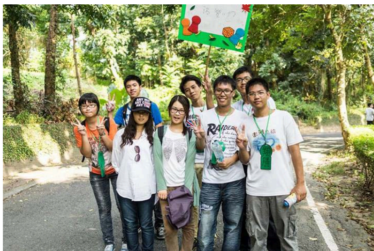
圖二：參與本系新生宿營（第一排左二）