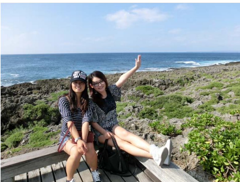
圖七：我在墾丁天氣晴（右）