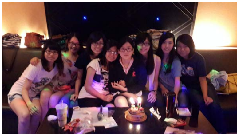
圖一：參與同學慶生活動（左二）

如果再讓給我一次機會，我還是會選擇來到臺灣交流，雖然這個抉擇會讓我捨棄很多，但，在這裏所獲的一切都是其他東西不可比擬的，我珍惜它！