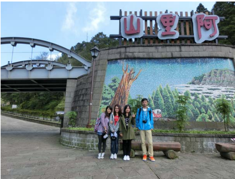
圖六：共游阿里山（左二）