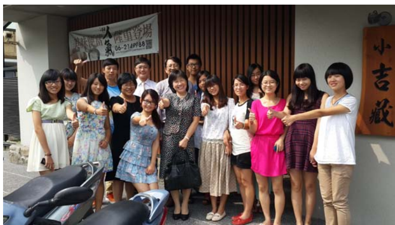
圖三：與校長等老師共進午餐（右七）