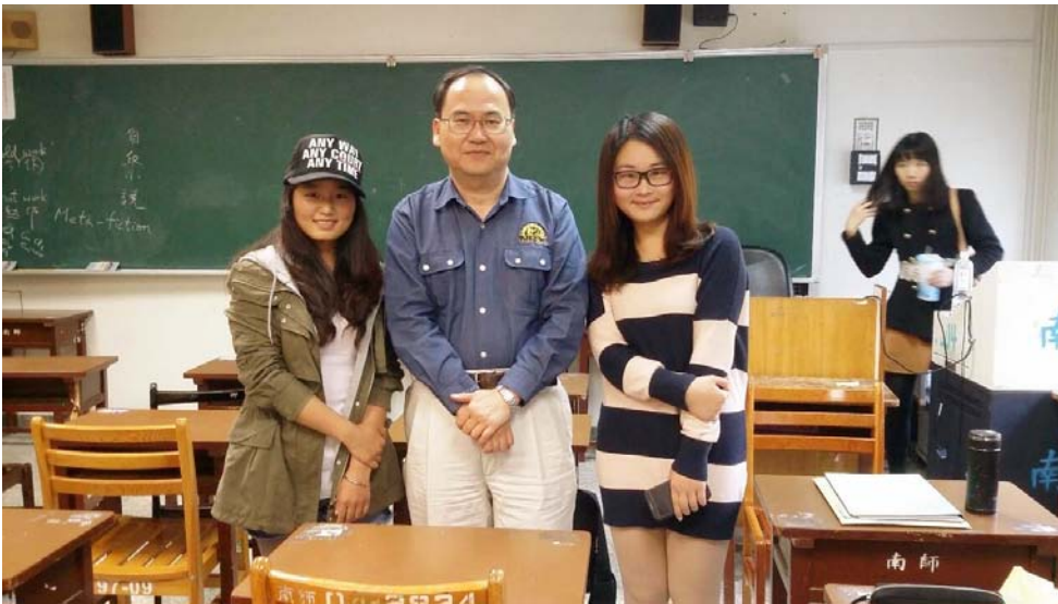
圖九：與班導、植物生理學老師合影（右）