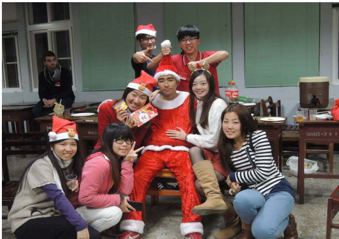
▲這是在西班牙課的聖誕節活動。當晚有幸與台灣的聖誕老人合照，樂趣無窮。

選到，我會有點不安，同時歡欣雀躍。因為我怕年紀輕輕，辜負"你"的好，亦怕不知如何好好地善用"你"。但我是開心的，甚至是安心的，因為從此以後 "你"就自由了，或等待另一好人家。感謝"你"，陪伴了我兩個月。從此以後，我只能在記憶中與"你"遊寶島...再見了，微風!