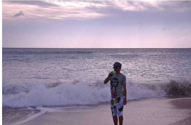
於太魯閣隧道內於墾丁海邊