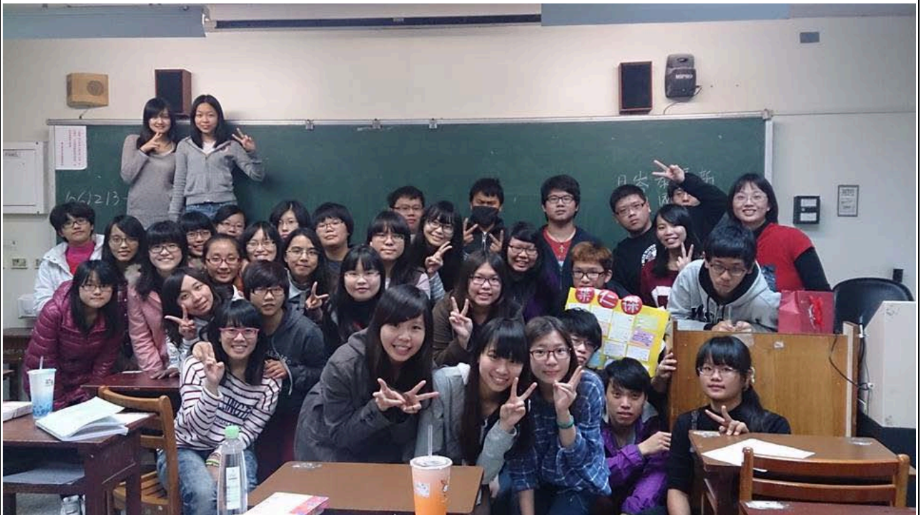
與國二甲全班合影