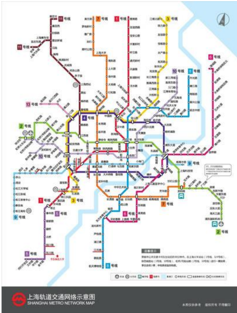
上海軌道交通網絡示意圖（上述網站已劃出）