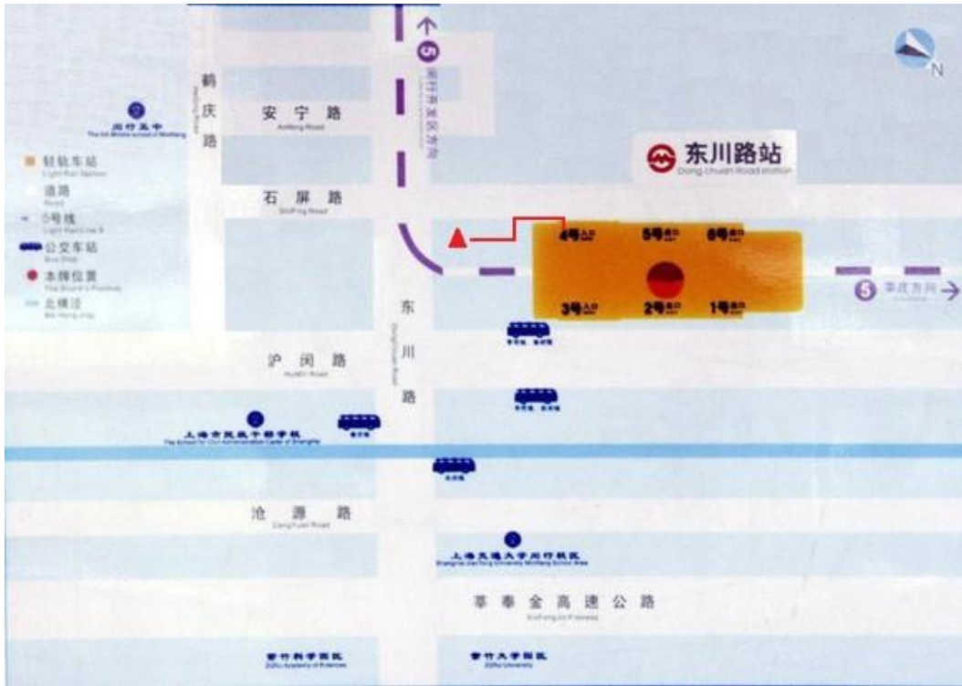
● 東川路站換乘江川3路路線圖（三角形處即江川3路終點站）