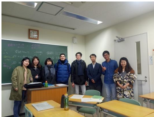
日本語語法論 學期結束大合照