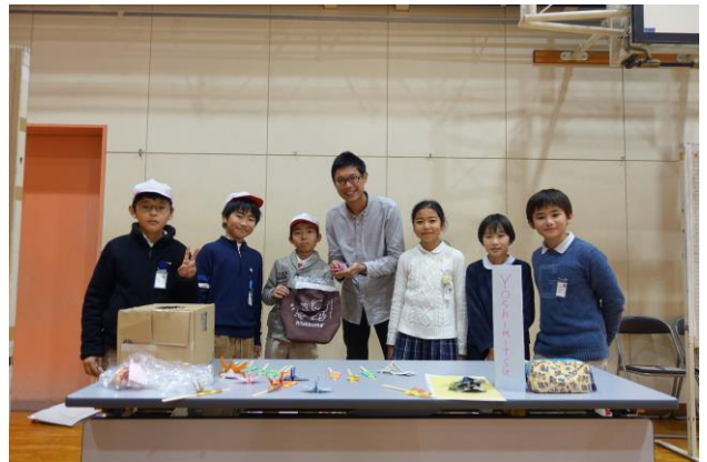
埼玉大學附屬小學校 與外國留學生的交流會