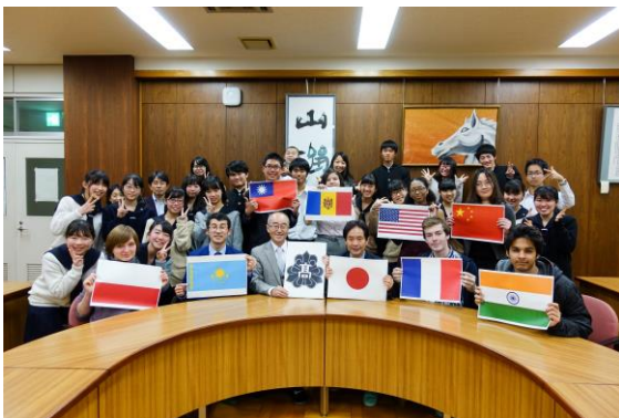
浦和高校 與外國留學生的交流會