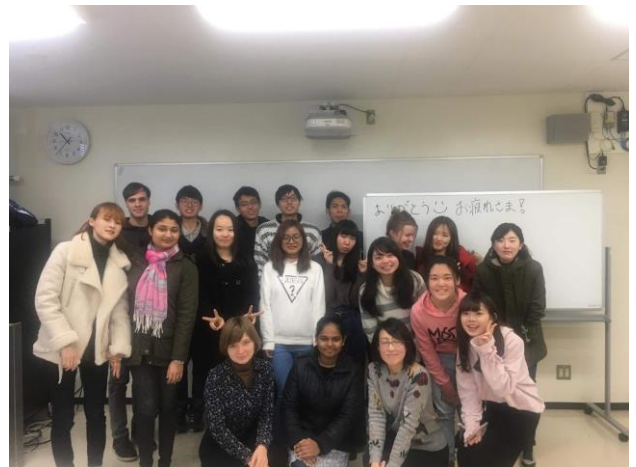
留學生的日文課， 學期結束大合照