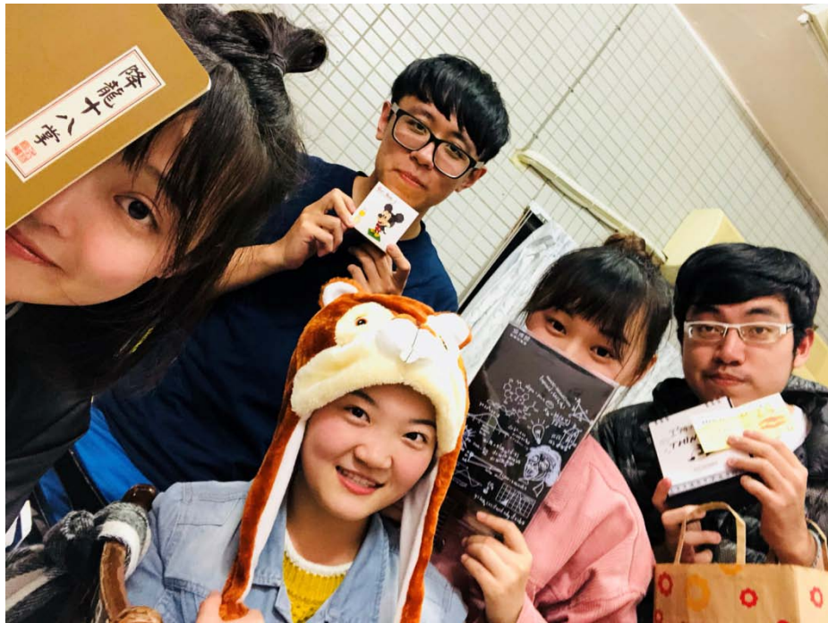
圖為耶誕節社團交換禮物合照