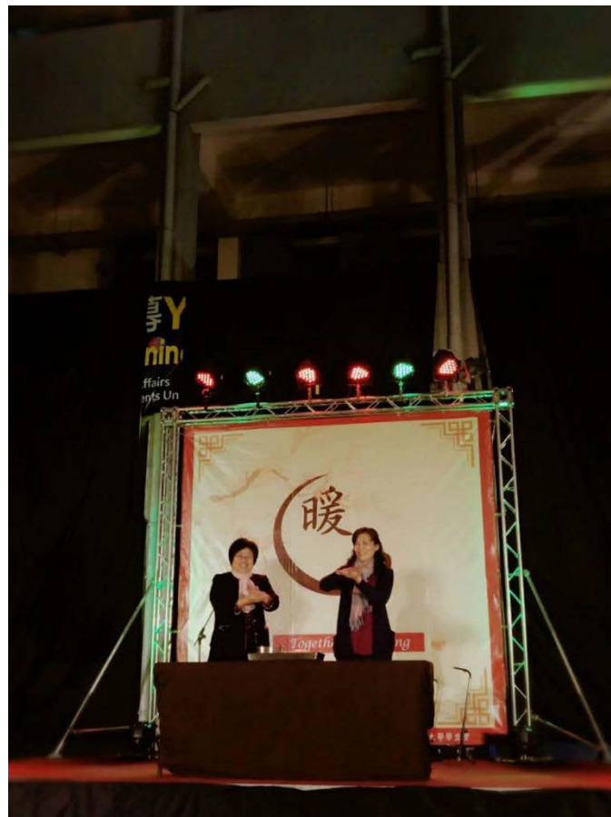
圖為冬至活動下鍋儀式