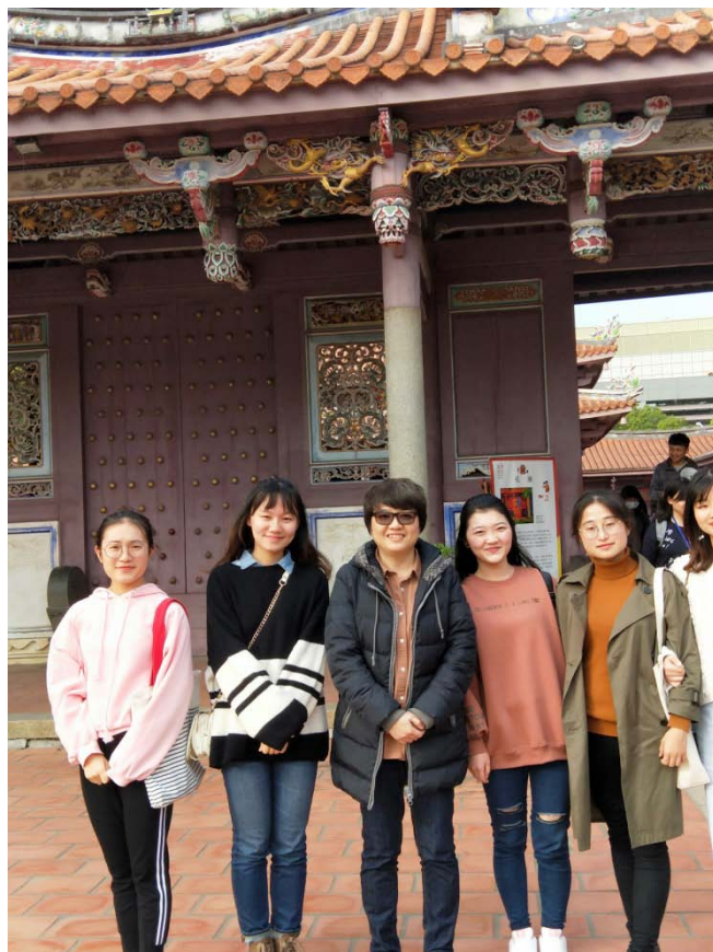
圖為參觀孔廟和莊老師的合照