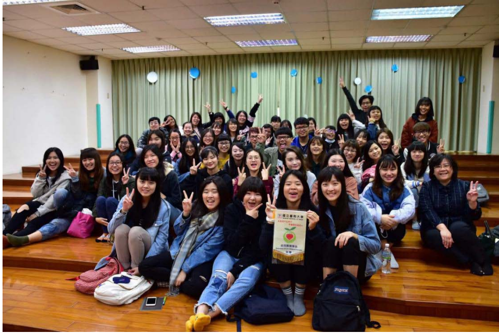
圖為班級參觀嘉藥幼稚園