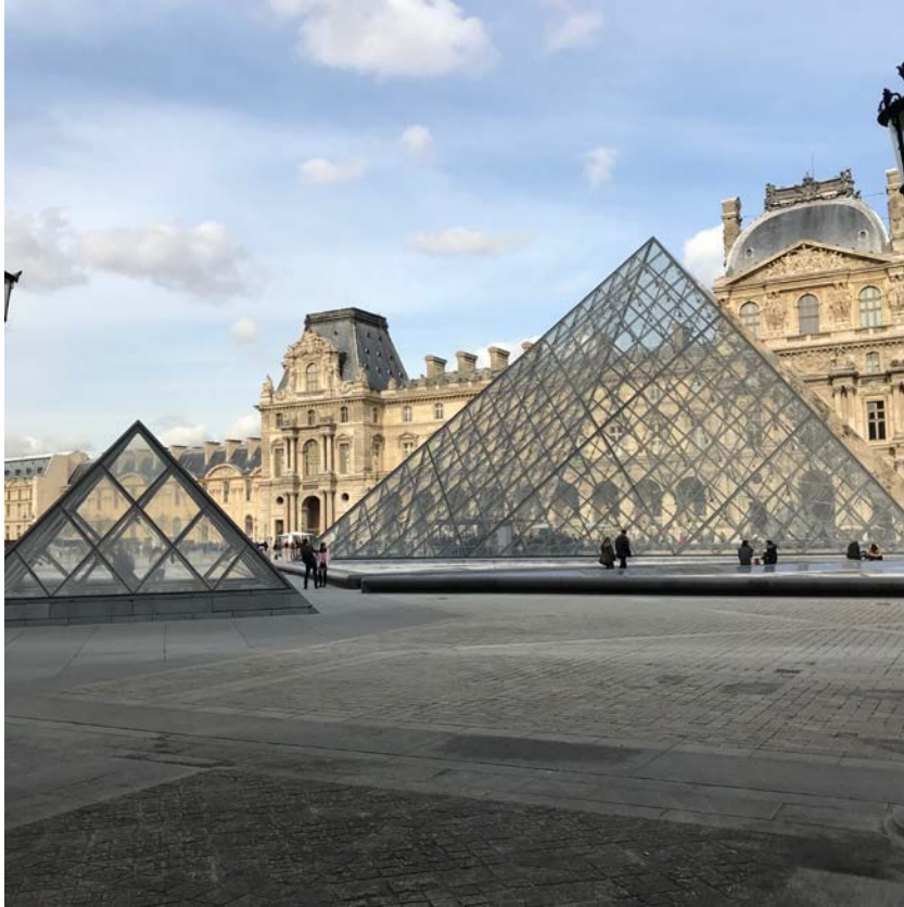
鼎鼎有名的羅浮宮