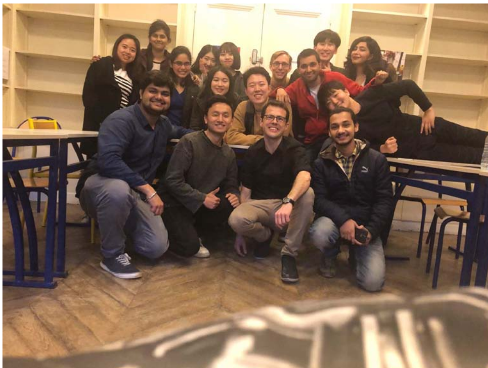
這位老師最後一堂教我們法文了 ☹